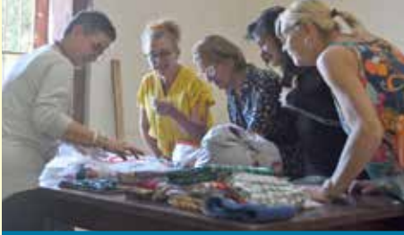
Konfi-Gabe 2026: Kuba